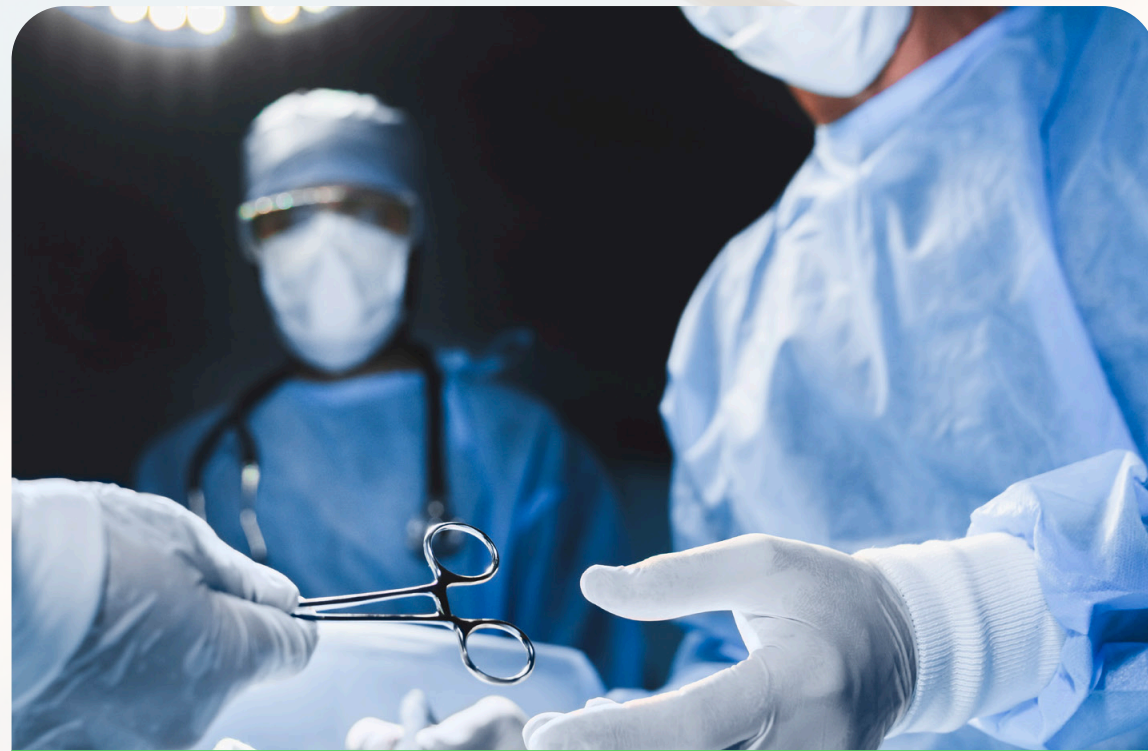
Transplante de órganos mayores